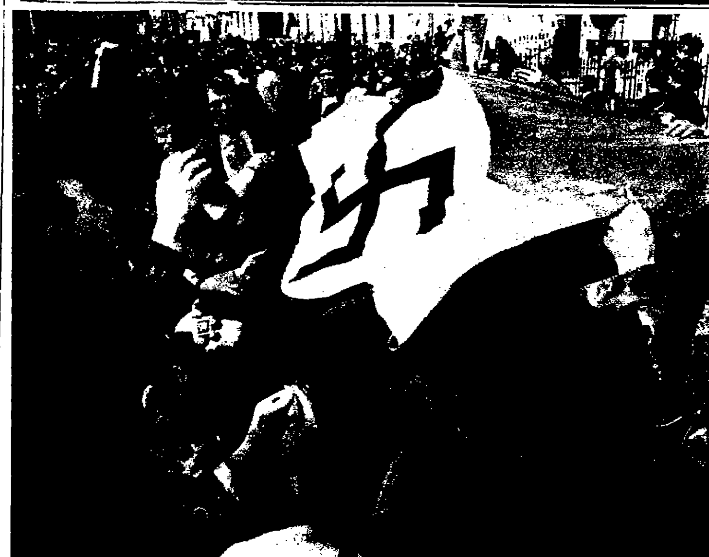
مشهد للمظاهرات التي جرت في تندزهد المتبا القوية بسبب محاولة اغتيال الزعيم الطغلامي اليساري « صوة ليوستيبوس »